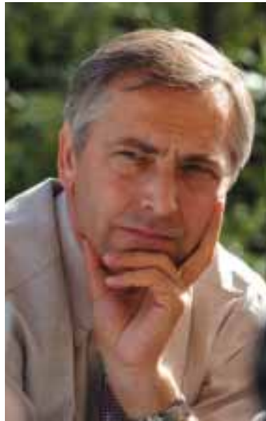
Ján Figel 1

C'est dans un tel contexte que le Conseil et le Parlement européen ont adopté, à la fin de 2006, un cadre européen des compétences clés pour l'éducation et la formation tout au long de la vie. Pour la première fois au niveau européen, ce cadre définit les compétences clés dont les citoyens ont besoin pour leur épanouissement personnel, leur intégration sociale, la pratique d'une citoyenneté active et leur insertion professionnelle dans une société fondée sur le savoir. Dans les États membres, les systèmes d'éducation et de formation initiaux devraient promouvoir le développement de ces compétences au bénéfice de tous les