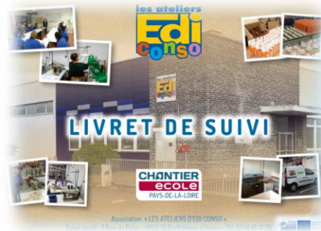
Livret de suivi Chantier insertion