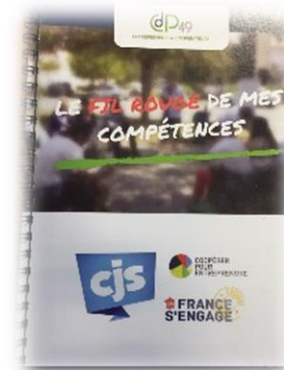
« Fil rouge des compétences » CJS